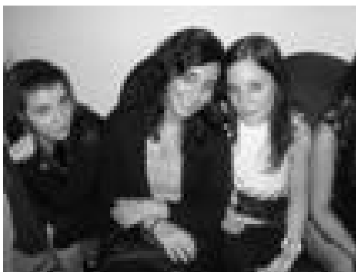
AM, Faro 1º ano de Ciências da Comunicação, UNL

Vim para Lisboa com uma mala recheada de sonhos. Agora, tenho em Lisboa os sonhos que trouxe e outros que fui descobrindo. A mala continua aberta, alguns sonhos vão-se perdendo, outros vão aparecendo. Ainda estou só nos descobrimentos iniciais, já dobrei alguns cabos mas sei que mais mundos ainda estão por descobrir.