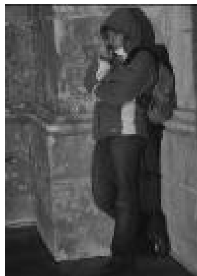
PF, Covilhã 2º ano de Economia, UCP

É assim, todos os meses, as inscrições para uma noite com os Sem-Abrigo aumentam. Felizmente temos esta oportunidade. Afinal, viver na Domus, é também fazer parte desta mudança que queremos ver no Mundo!